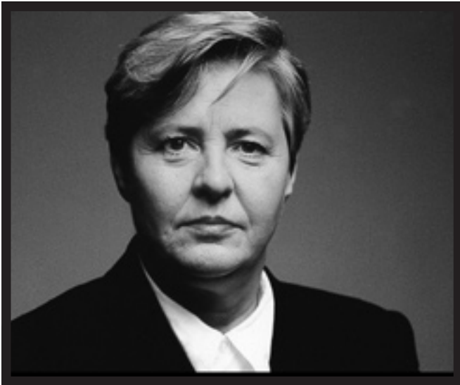
Der BSA trauert um Johanna Dohnal

Am Samstag, dem 20. Februar 2010, verstarb Johanna Dohnal, die erste Frauenministerin Österreichs, im 72. Lebensjahr. Sie war eine der ganz großen historischen Persönlichkeiten der Sozialdemokratie, die für die Sache der Frau Großartiges