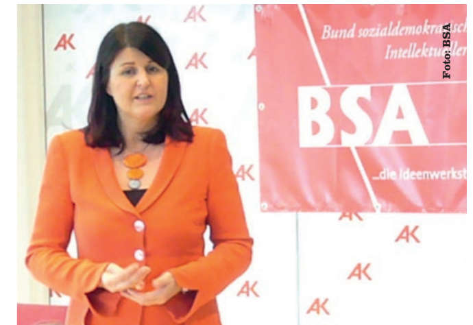
Landeshauptfrau Mag.a Gabi Burgstaller bei ihrem Vortrag im BSA Salzburg

eine entsprechende Durchlässigkeit die Gewähr gegeben, dass sämtliche Ressourcen, Fähigkeiten, Begabungen der Volkswirtschaft zur Verfügung stehen und nicht ungenutzt bleiben. Dieses Anliegen bzw. die bestehenden Defizite sind nicht neu, sondern seit Jahrzehnten bekannt. Sie wurden bereits in den 70er-Jahren als solche erkannt, entsprechende bildungspolitische Umsetzungsmaßnahmen wurden gesetzt, doch die Grundproblematik ist bis heute aktuell und ungelöst.